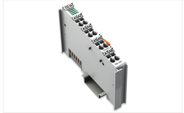
Farbe: ■ lichtgrau