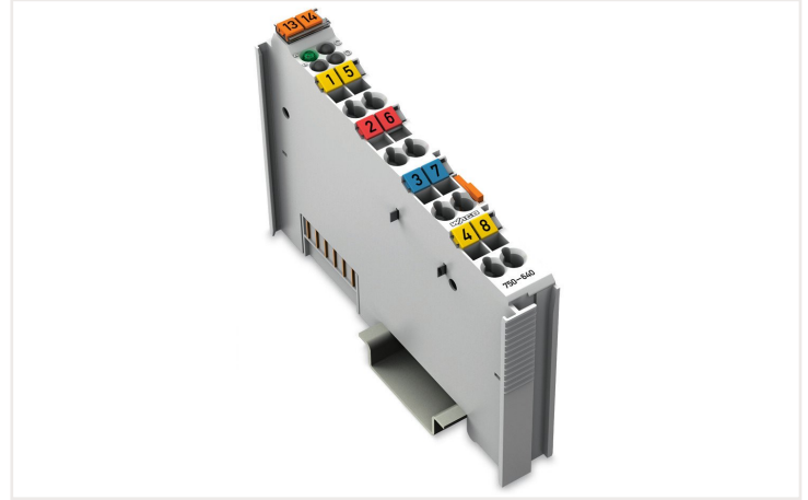
Farbe: ■ lichtgrau