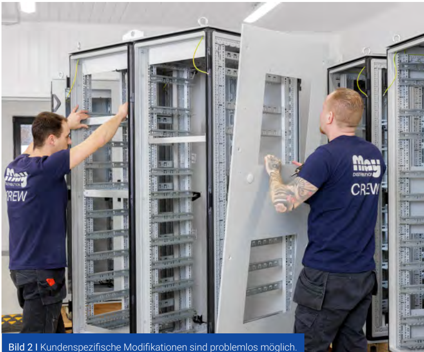
Bild 2 | Kundenspezifische Modifikationen sind problemlos möglich.

che, Bedruckung, Sonderfarben oder eine spezielle Frontplattengestaltung modifiziert werden müssen, kümmert sich der Distributor um die Umsetzung. Der Kunde erhält auf Wunsch ein fertig aufgebautes Produkt inklusive aller Einbau- und Zubehörteile sowie fertig montierter Baugruppen. Auch eine Konfektionierung von Leitungen als Einzelstück oder Serie ist möglich, ebenso eine Lagerbevorratung nach Kundenabsprache.