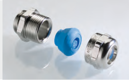
Abb. 2 Fig. 2

Messing vernickelt Metrisches Gewinde EN 60423 Schutzart IP 68 bis 15 bar, IP 69K, Type 4X