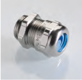
Abb. 1 Fig. 1