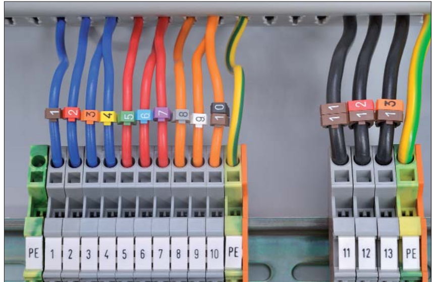
WIC-Markierer eignen sich besonders für die Kennzeichnung nach der Montage.

Dieser praktische Clip wird besonders im Maschinenbau sowie im Schaltschrank- und Anlagenbau eingesetzt.