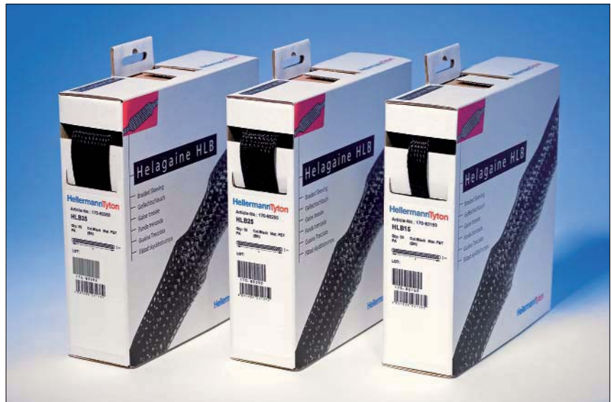
Helagaine HLB – die Aufweirrate 3:1 macht es möglich: nur 3 Größen in der handlichen Spenderbox für fast alle gängigen Durchmesser.

Die praktische Spenderbox und das übersichtliche Sortiment mit seinen großen Anwendungsmöglichkeiten machen Helagaine HLB zum idealen Partner sowohl im Profibereich als auch zu Hause. So lassen sich z. B. Leitungen von Hi-Fi-Anlagen, Präsentations-Equipment oder Kabelstränge von Industrieanlagen bündeln. Neben einer sauberen Optik werden die Leitungen durch Helagaine HLB auch vor Abrieb geschützt.