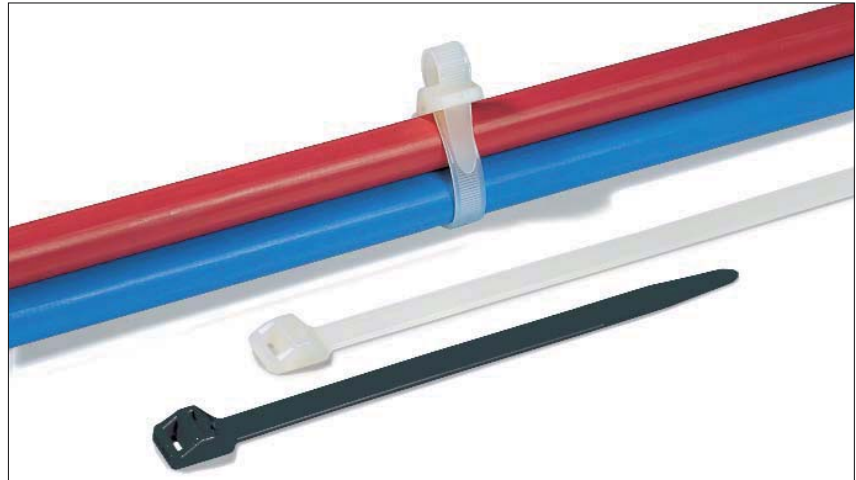
Für große und schwere Bündelungen lassen sich die RT250-Kabelbinder verwenden.

Diese Kabelbinder eignen sich für alle Arten von schweren Bündelungen, insbesondere auf Baustellen bei der Verlegung von Kabeln, Leitungen und Schläuchen.