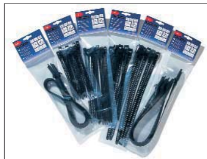
Die SOFTFIX-Family ist in praktischen Kleinverpackungen erhältlich.