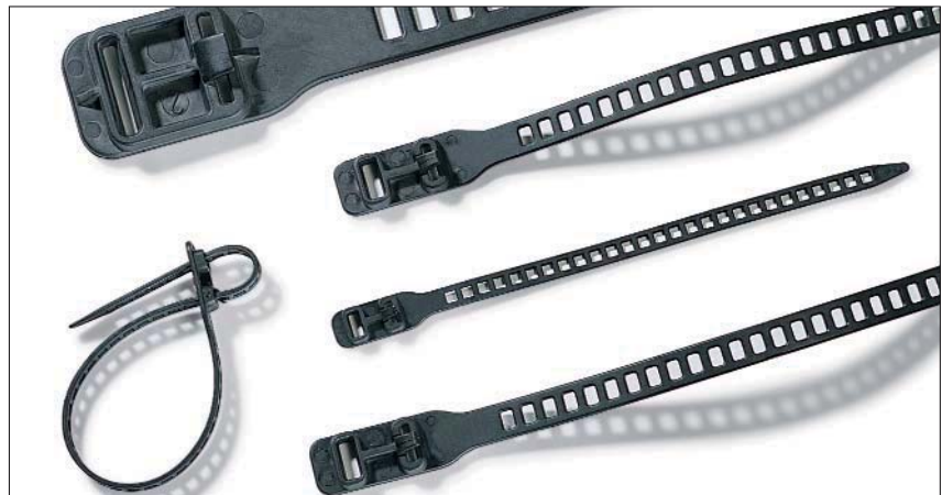
Elastisch und vielseitig einsetzbar sind die SOFTFIX-Kabelbinder.

Alle Arten von Bündelungen, besonders für Lichtwellenleiter, im Außen- und Innenbereich sind Einsatzgebiete für diese Kabelbinder. Des Weiteren bietet sich dieser Wiederöffnungsbinder für Garten- und Landschaftsbau, Musikveranstaltungen und Baumschulen an. Die SRT-Serie in größeren Verpackungseinheiten bietet sich für den Industriebedarf an.