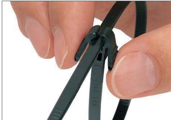
Der REZ-Kabelbinder lässt sich einfach wieder öffnen.

Die REZ-Kabelbinder sind überall dort geeignet, wo ein einfaches und schnelles Wiederöffnen wichtig ist, z. B. bei der Vormontage in der Kabelkonfektion.