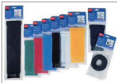
Die TEXTIE-Serie ist in verschiedenen Abmessungen und Farben erhältlich.

Auf Anfrage sind Halter zur Befestigung erhältlich. Sprechen Sie uns an!