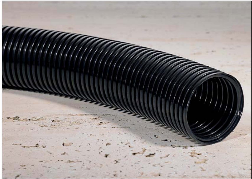
HelaGuard HG-HI PA12 ist sehr gut für den Einsatz in Robotern geeignet.

Dieser Wellschutzschlauch wird in Robotern, Eisenbahnen sowie im Maschinen- und Anlagenbau eingesetzt. Durch seine Flexibilität hält er in Umgebungen mit ständiger Bewegung stand.