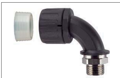
HelaGuard HGL-90M, 90°-Verschraubung mit drehendem Messing-Außengewinde inkl. Schlauchdichtung.