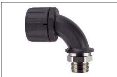
HelaGuard HG-90M, 90°-Verschraubung mit drehendem Messing-Außengewinde.