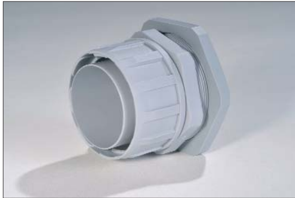
FG-M Verschraubung mit metrischem Gewinde.

Die FG-M und FG-P Verschraubungen kommen dort zum Einsatz, wo ein erhöhter Staub- und Flüssigkeitsschutz gewünscht ist. Sie werden mit den FlexiGuard-Schläuchen verwendet.