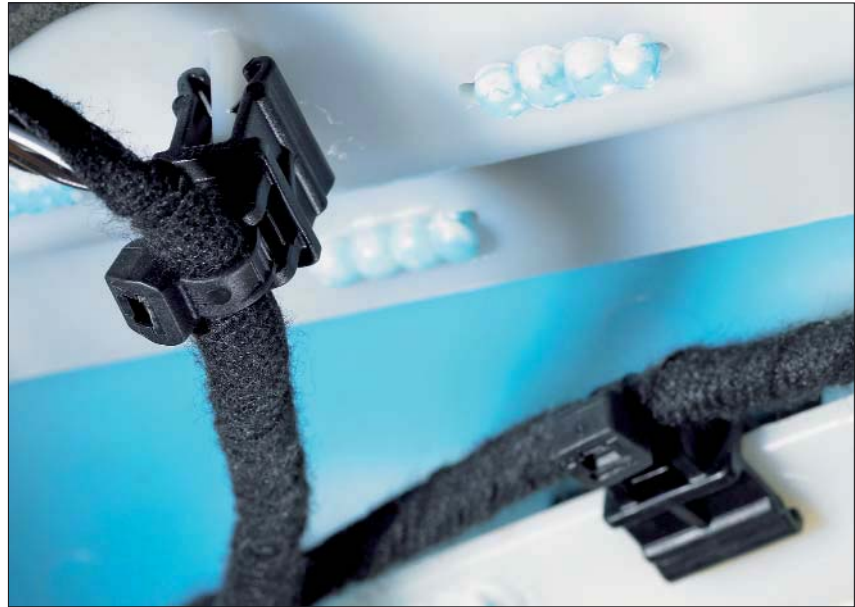
T50ROSEC10 auf eine Kunststoffkante gesteckt.

Die Kombination aus EdgeClip und Kabelbinder ist eine sehr gute Alternative überall dort, wo Lochbohrungen nicht akzeptabel und Kleber aufgrund höherer Temperaturen nicht einsetzbar sind. Anwendung findet die EdgeClip-Family zur Bündelung und Befestigung von Kabelbäumen und Schläuchen in der Elektroindustrie, im Schaltschrankbau und in der Automobilindustrie.