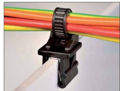
Der einteilige Befestigungsbinder T50ROSEC12 kann einfach auf Kanten aufgedrückt werden.