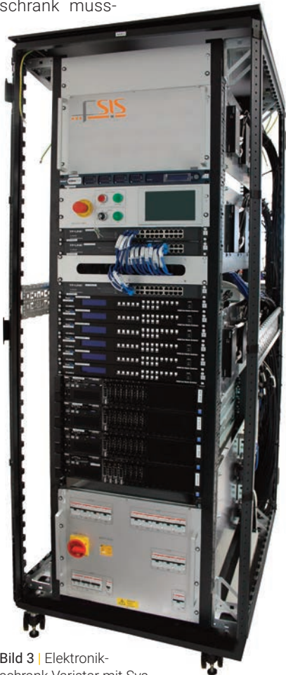
Bild 3 | Elektronikschrank Varistar mit System-Komponenten für einen 'full mission simulator' zur Ausbildung von Lokführern

Im erwähnten Bahnprojekt sollten die Komponenten des Schienenüberwachungssystems in einem Elektronikschrank untergebracht werden. Dabei spielte die sinnvolle Anordnung von Baugruppen und Systemkomponenten sowie die Integration kundenspezifischer Module im Bereich Elektrotechnik und Mechanik eine ebenso wichtige Rolle wie präzise beschriftete Einzellitzen, die das effiziente und damit kostensparende Verdrahten ermöglichen. Im Elektronikschrank muss-