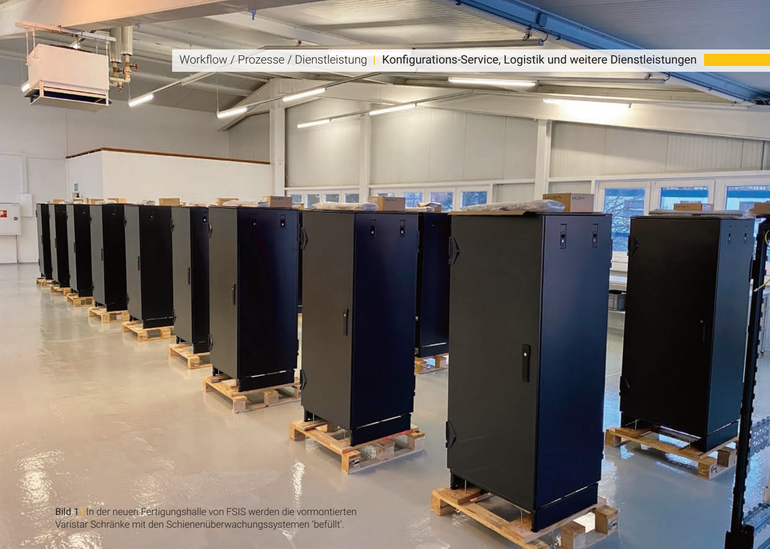
Bild 1 | In der neuen Fertigungshalle von FSIS werden die vormontierten Varistar Schränke mit den Schienenüberwachungssystemen 'befüllt'.