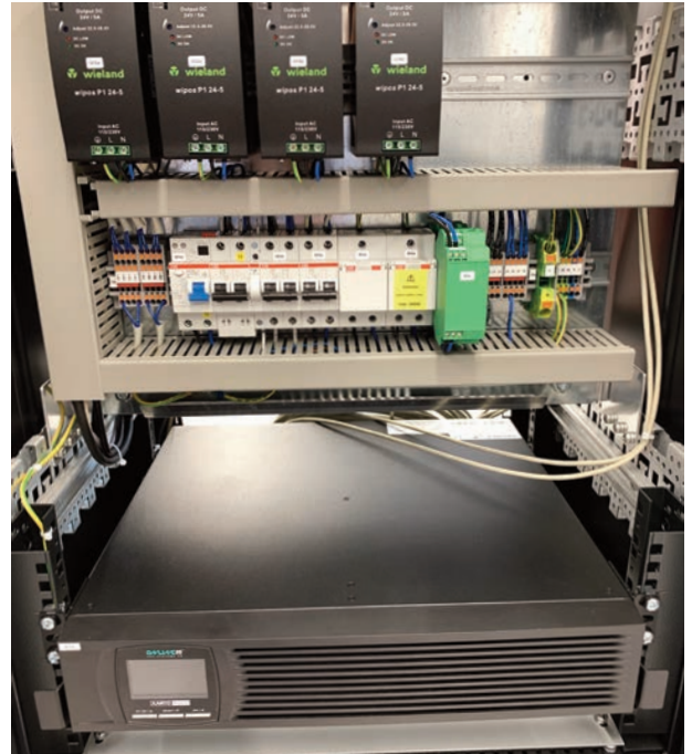
Bild 2 | Die Integration der Stromversorgung inklusive USV gehört zum Standard.

Bei der Auswahl und Konfiguration eines passenden Elektronikschrankes wurde FSIS von der May Distribution aus Berlin unterstützt. FSIS arbeitet bereits seit vielen Jahren mit dem Distributor und Engineering Partner May zusammen und das nicht nur, wenn es um Schränke geht. FSIS bezieht über May auch Baugruppenträger inklusive Zubehör wie Kassetten, Frontplatten und Steckver-