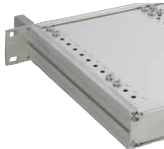
Hohe Stabilität durch Aluminium- Profilsitenwand