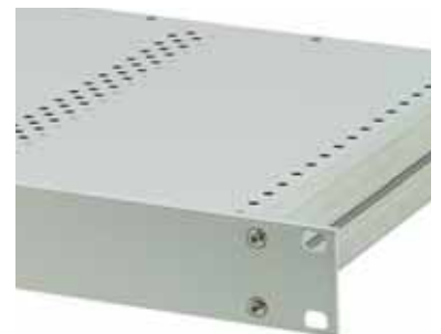
Für genormten Leiterplattenausbau