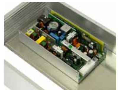
Montageplatte zum Einbau schwerer Komponenten