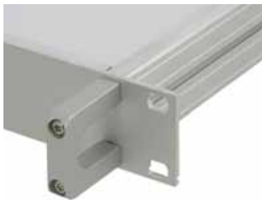
Griffe frontseitig anschraubbar