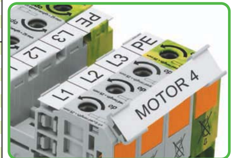
Adapter für Beschriftungsstreifen bzw. 2 x WMB

Systembeschreibung und Handhabung siehe Seiten 462 und 463