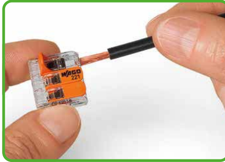
Leiter anschließen: Klemmstelle durch Betätigungshebel öffnen und Leiter einführen.