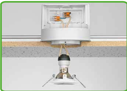
Individueller Aufbau von Niedervolt-Beleuchtungssystemen