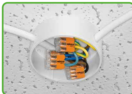
Leuchtenverteilung in Deckenbaldachin