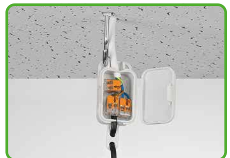
Anschluss von Pendelleuchten in abgehängten Decken

Der CAGE CLAMP®-Anschluss klemmt folgende Kupferleiter:*